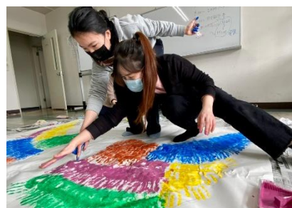
畢業作品手工油畫